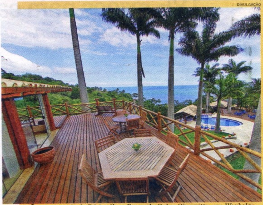
CASAL a partir de R$ 3 mil na Pousada Solar Singuitta, em Ilhabela