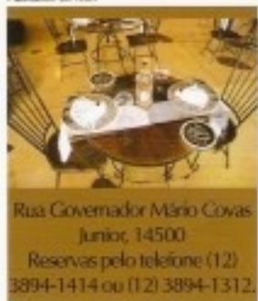
Rua Governador Mário Covas Junior, 14500 Reservas pelo telefone (12) 3894-1414 ou (12) 3894-1312.

Na Pousada Solar Singuita ainda é possível realizar toda uma programação especial. Depois de curtir uma relaxante massagem no SPA da pousada, o cliente pode desfrutar das iguarias gastronômicas do restaurante.