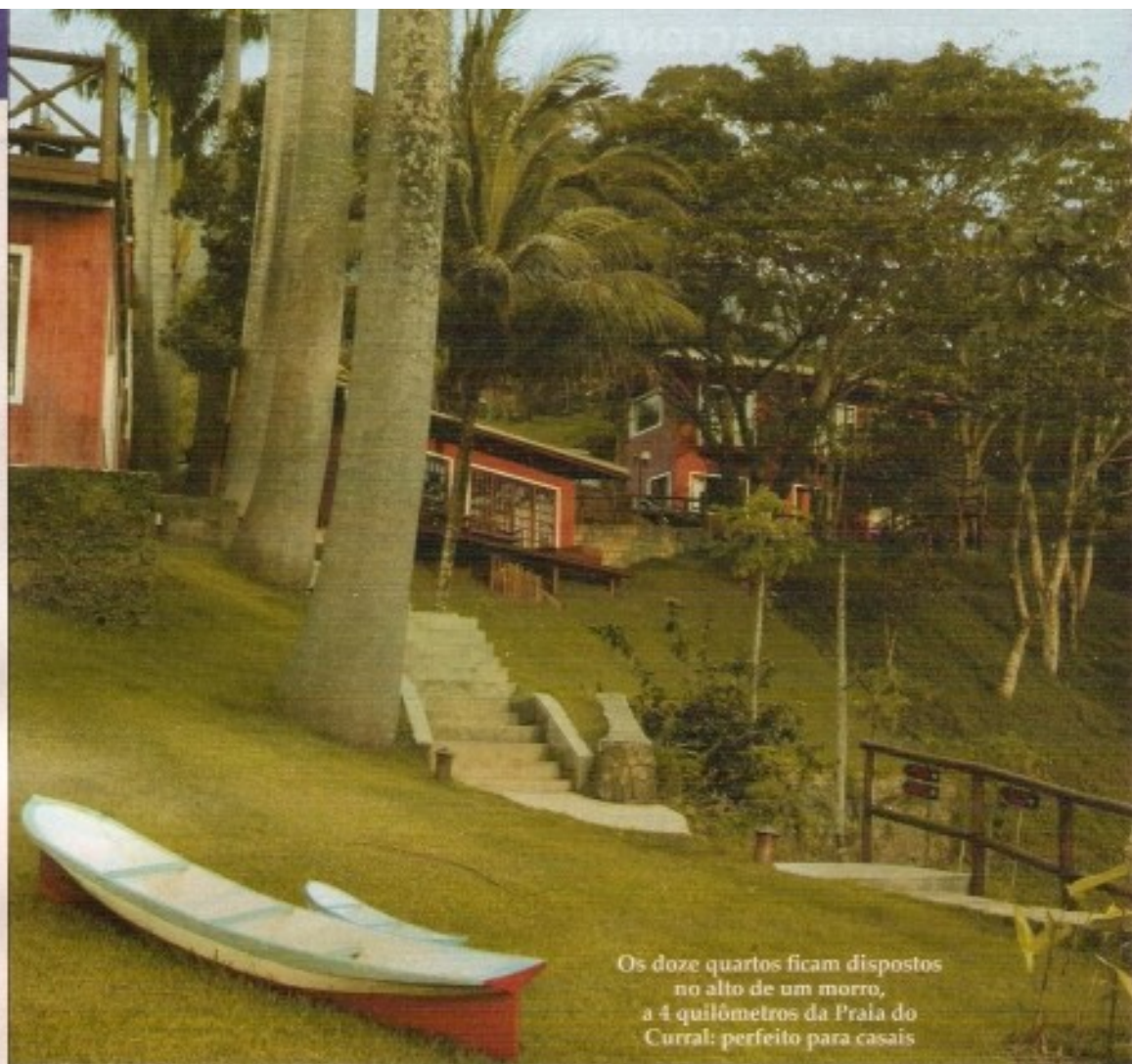
Os doze quartos ficam dispostos no alto de um morro, a 4 quilômetros da Praia do Curral: perfeito para casais