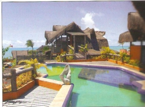
Da Pousada Solar Singuitta (à esq.), tem-se uma ótima vista do mar de Ilhabela (SP); o Orixás Art Hotel (à dir.), em Flexeiras (CE), é decorado com motivos africanos